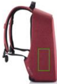
Artikel linke Seite unten