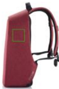
Artikel rechte Seite oben