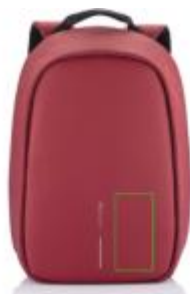
Artikel Vorderseite rechts