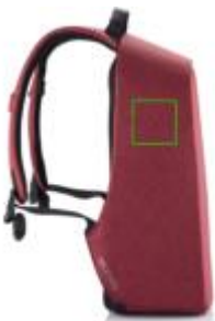
Artikel linke Seite oben