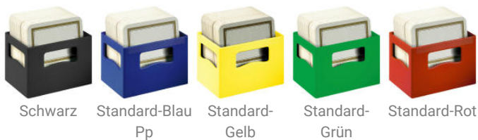
Schwarz Standard-Blau Standard-Gelb Standard-Grün Standard-Rot Pp